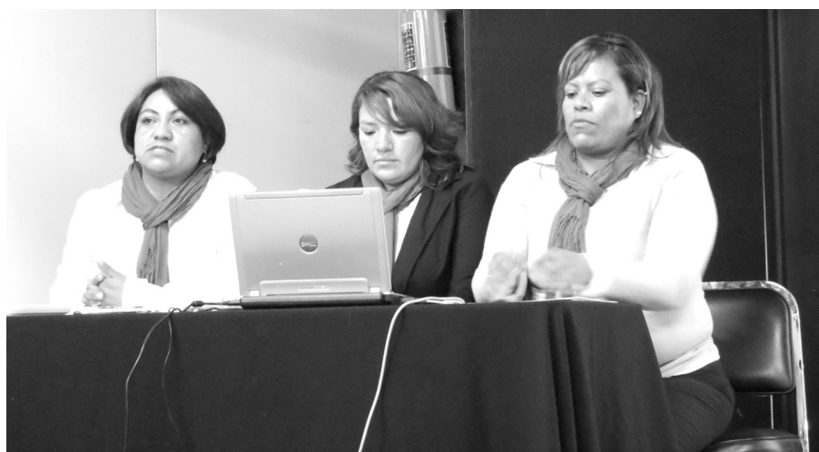
Grupo de trabajo de la prueba piloto "Ardillitas al rescate"

ga de brindar asesoría muy puntual a los alumnos y trabajar con estrategias de reflexión y narrativa, señala que es importante compartir y difundir el trabajo que se está realizando, acercarse a distintas iniciativas para de esta forma contribuir a la formación de profesionales críticos y reflexivos.