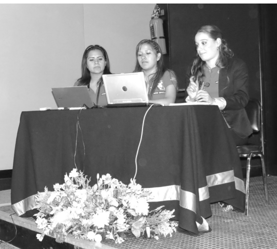
Grupo de trabajo en Universum